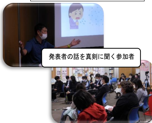
発表者の話を真剣に聞く参加者

現在イベントの人数制限は、大声での歓声・声援などが無いものは収容率100パーセント以内、大声が想定されるものは50パーセント以内、クラシック演奏会などは満席容認など、収容率や人数の上限は異なりますが、緩和が始まっています。感染対策として、飲食の制限、事前登録で参加者の把握、ウェブでの入力フォームの活用、オンラインでの開催など、非接触で安全なイベント開催が望まれます。