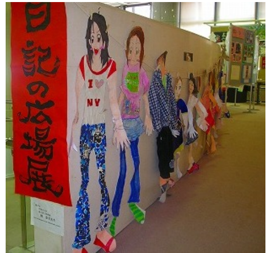
—等身大の子どもたち—