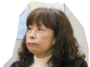
須保さん： 昨年は福祉関係の出前講師の勉強を始めた。