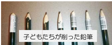
子どもたちが削った鉛筆

昨年度、北九州市との協働事業で実施した調査で、小学生にナイフで鉛筆が削れるか質問してみました。「削ったことがある」と答えた子どもは36.2%で、「上手にできる」と答えた子どもは11.3%でしたが、実際にきれいに鉛筆を削ることができた子どもはいませんでした。これが今の子どもたちの現実です。