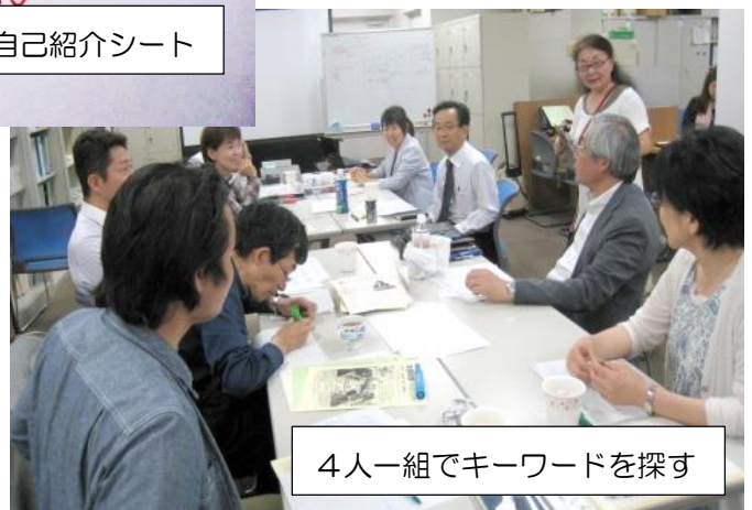
4人一組でキーワードを探す

「ひと・もの・こと」に興味・関心を広く持って、時間や手間をかけて、いろいろなところに顔を出すこと。それがマンネリではない「しあわせな活動」につながるのではないのでしょうか。