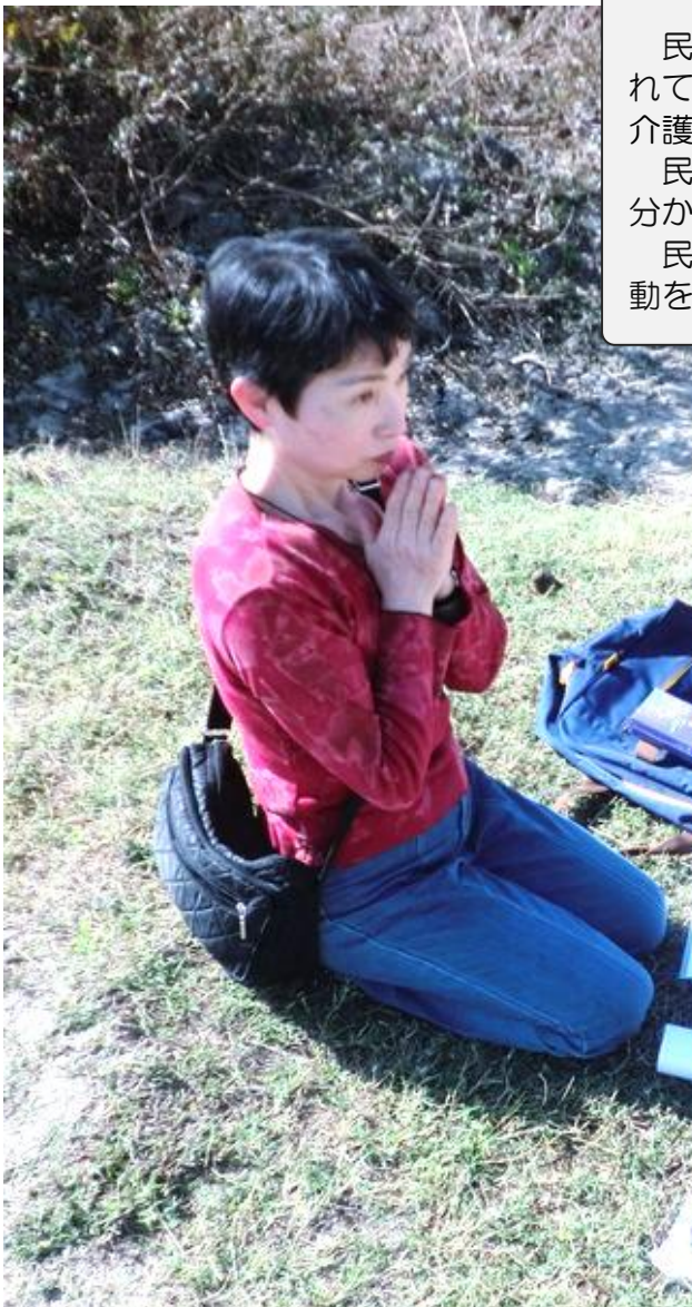
表紙写真：2014年2月 ミャンマーピンダレーの日本軍の野戦病院跡地にて 亡くなった患者と勤務者に手を合わせて供養をする