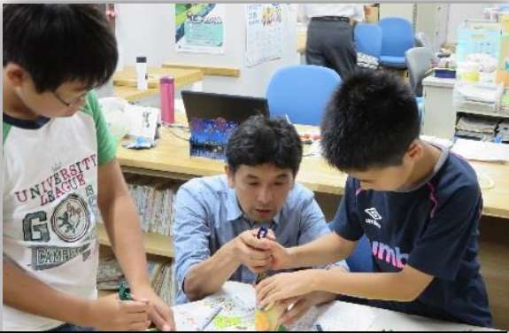
缶切り初挑戦。使い方から教わります。

都市化や生活スタイルの変化にともない、子どもたちが木登りをしたり刃物を使ったりする機会が減っています。また、親は子どもに怪我をさせたくない「親心」から、危ない事から遠ざけがちです。