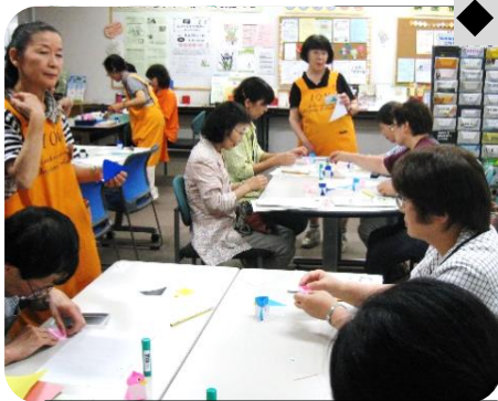
参加者一人一人に丁寧な指導