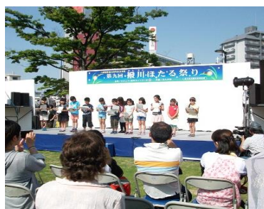
撥川ほたる祭りでの飼育発表