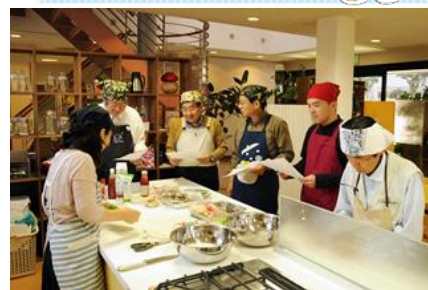
▲最近では男性の参加者が増えています！

料理教室では季節にあった薬膳レシピを積極的に取り入れて楽しく学んでいます。料理教室の生徒の中には、団体の想いに共感し、薬膳の活動に参加するようになった方もいます。その他、“家庭でできる美味しい薬膳”をテーマに、一般の方向けの講座を定期的開催しています。これからも、長寿食として注目される「日本食」と、中国で長い間受け継がれてきた「薬膳」を融合させ、できるだけ日本の食材を使い、日本人の体質や味覚に合った新しく美味しい日本型の薬膳を提案していきたいと考えています。