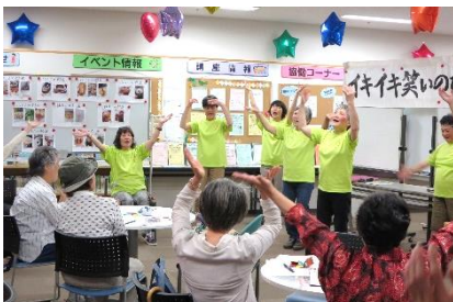
とにかく皆さん「元気」 声もしっかりマイクいらす！

メンバーは楽しいこと、面白いことをキャッチするために、日々アンテナを張りながら過ごしています。誰かを笑顔にすることが、メンバーの楽しみ、生きがいになっており、衣装や小道具を手作りすることも苦になりません。