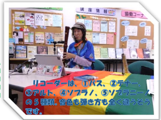
リコーダーは、①バス、②テナー、③アルト、④ソプラノ、⑤ソプラニーノの5種類。音色も弾き方も全く違うそうです。