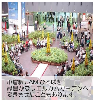
小倉駅 JAMひろばを緑豊かなウエルカムガーデンへ変身させたこともあります。

【花壇づくり支援&ボランティア育成】小倉北区の勝山公園をはじめ市内各所で行われるガーデニングイベントに参加し、花壇づくりの助言・支援を行うとともに、ボランティアの育成等にも取り組んでいます。