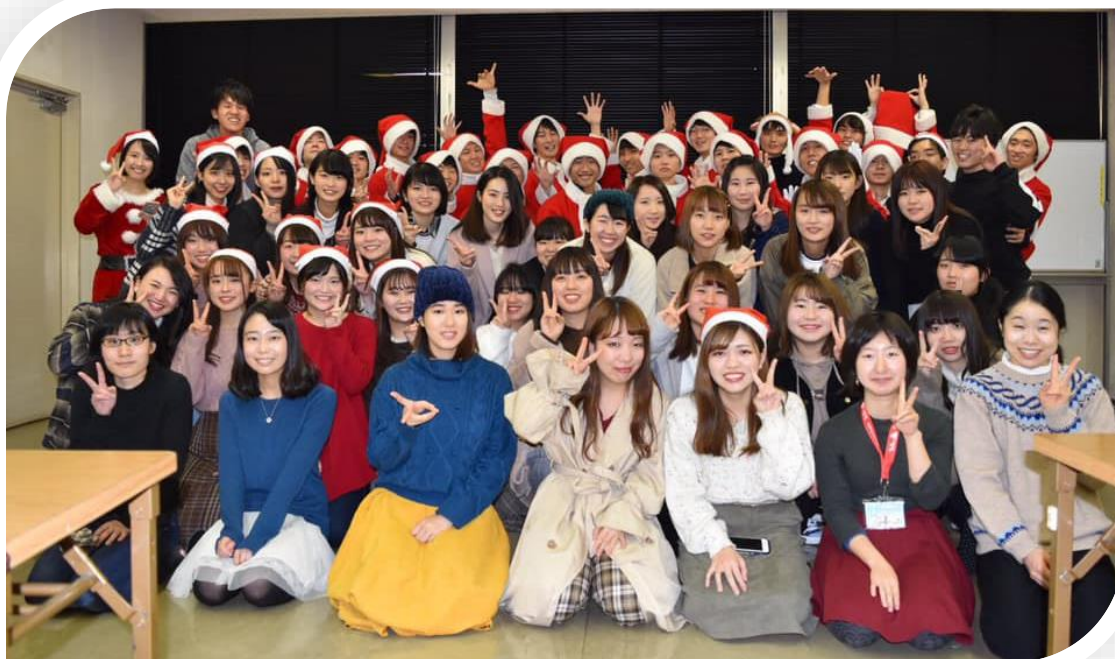
第196回 サポートセンターの日 発表団体