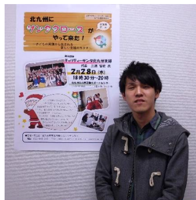
チャリティーサンタ

今年のクリスマスに向けて、スタッフ募集中です。スタッフが増えれば、もっと多くの子どもたちにプレゼントを届けることができます。年齢や性別は問いません。サンタになりたい方はHPから申し込みをお願いします。