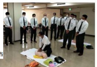
胸骨圧迫・人工呼吸による心肺蘇生講習