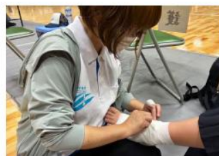
中体連競技大会で捻挫したの負傷者の応急手当